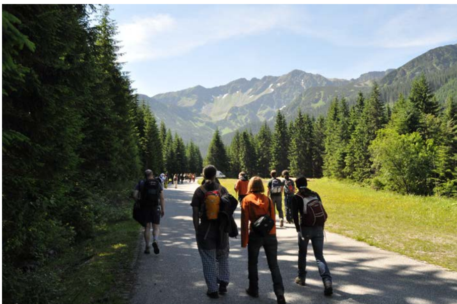
Obrázky z exkurze k Roháčským plesům v Západních Tatrách v rámci XVI. konference ČLS a SLS